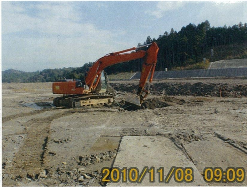
【写真タイトル】①掘削 【写真区分】バックホウ による掘削開始