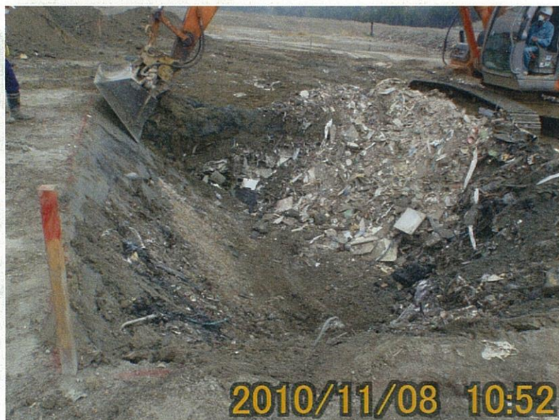
【写真タイトル】③掘削 【写真区分】固定工を 標に掘削中