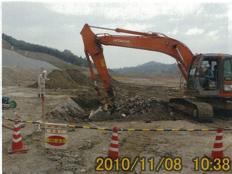
【写真タイトル】②掘削 【写真区分】バックホウ により掘削中