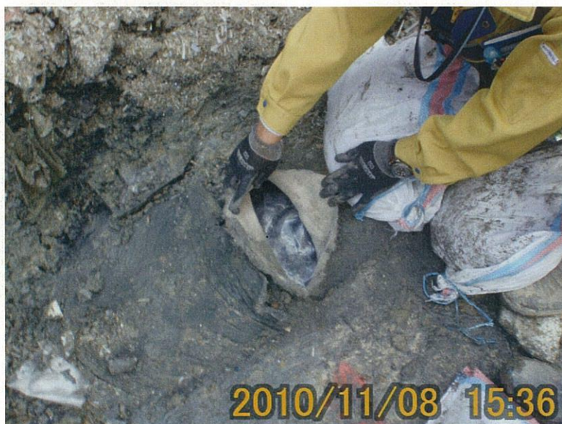
【写真タイトル】③補修 テープによる止水養生 (セ-20-2)