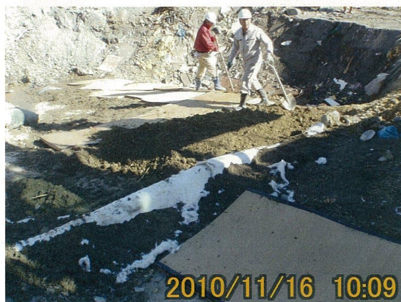
【写真タイトル】27 遮水シート保護のため、保護土の人力による敷き均し