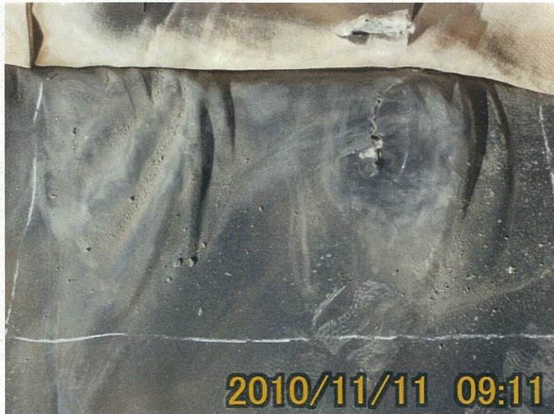
【写真タイトル】⑨保護 マット展開後状況写真(セ-20-1) 損傷延長 10cm