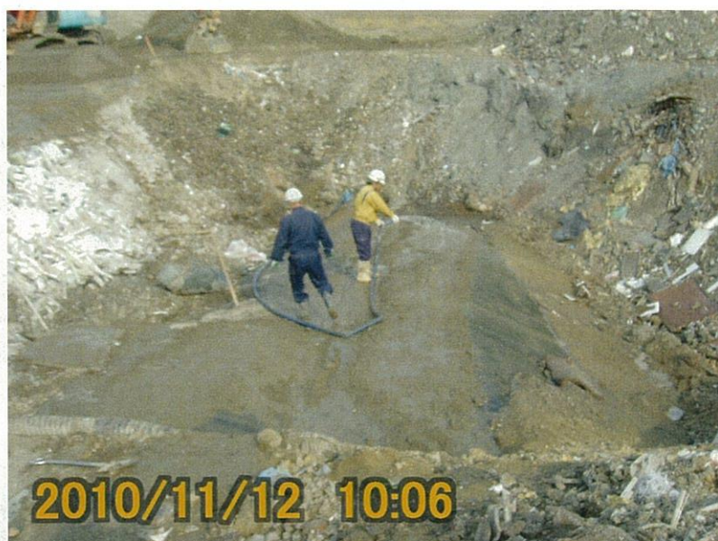
【写真タイトル】25 シート補修後、検知器による異常検知がされないか確認のための散水状況