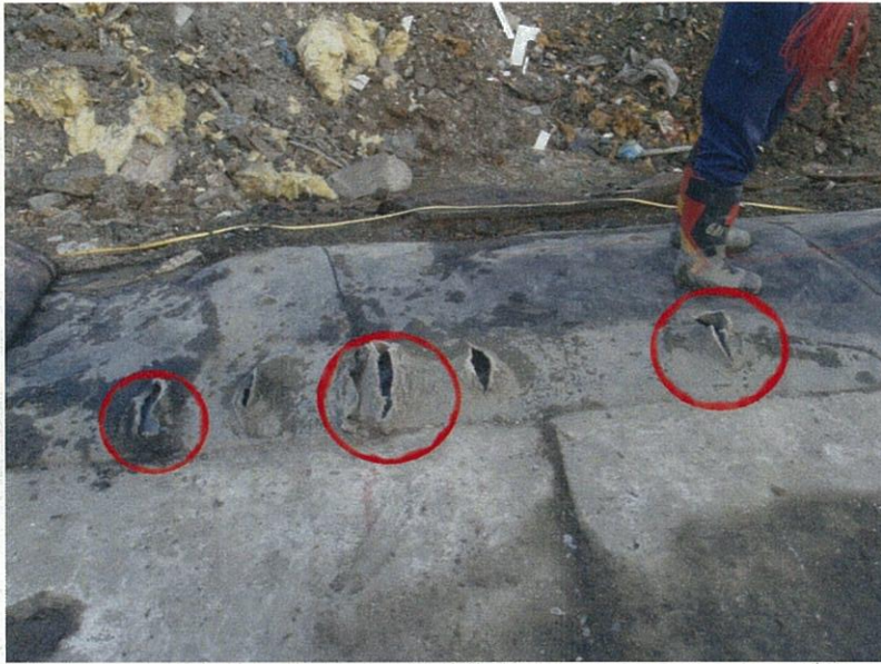
【写真タイトル】①状況写真