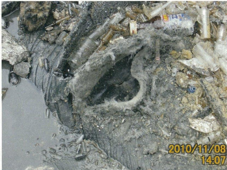
【写真タイトル】②損傷 箇所近接撮影 (セ-20-2)

【写真区分】写真の赤円 印がシート損傷箇所。左 からセ-20-1、セ-20- 2、セ-20-3