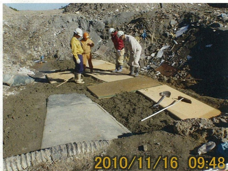
【写真タイトル】26 遮水シート保護のため、畳を人力により敷設