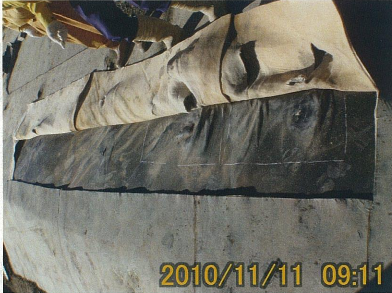
【写真タイトル】⑧保護 マット展開後状況写真