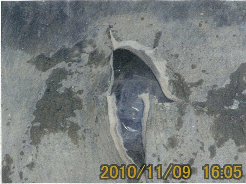
【写真タイトル】⑦補修 テープによる止水養生 (セ-20-3)