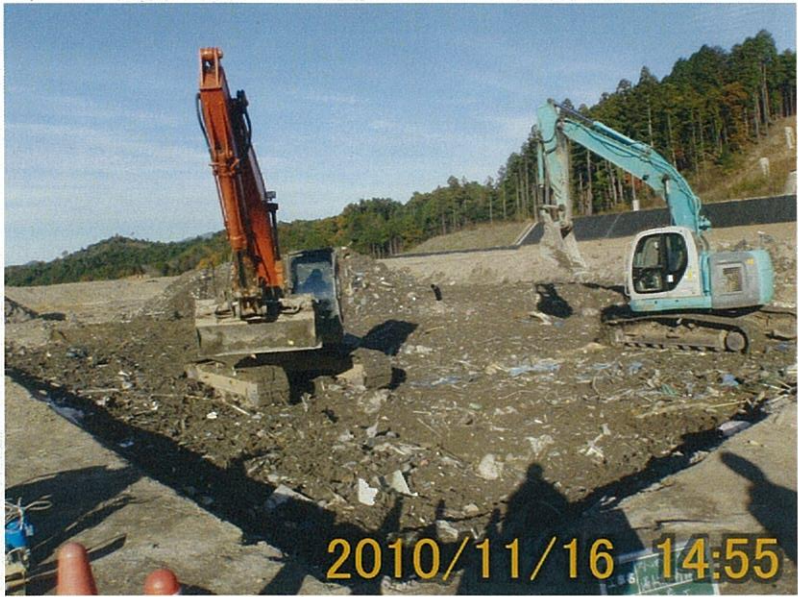
【写真タイトル】 29 覆土搬入と敷き均し状況